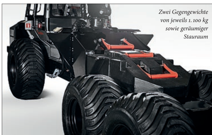
Zwei Gegengewichte von jeweils 1.100 kg sowie geräumiger Stauraum