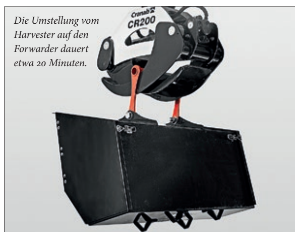
Die Umstellung vom Harvester auf den Forwarder dauert etwa 20 Minuten.

Kombimaschine für den Bestandeseinschlag mit einfacher und schneller Umstellung auf Forwarder oder Harvester ohne Abstriche bei der Produktivität und Leistung. Dank der einzigartigen Lösung mit abnehmbaren Gegengewichten zeichnet sich die Kombimaschine durch eine Leistung aus, die einem traditionellen Harvester entspricht.