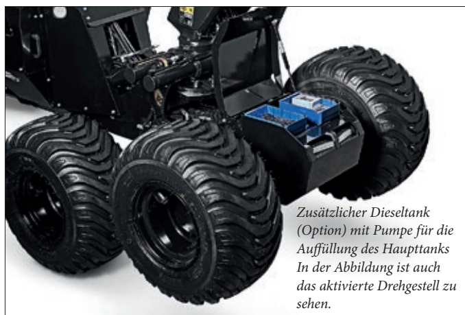
Zusätzlicher Dieseltank (Option) mit Pumpe für die Auffüllung des Haupttanks. In der Abbildung ist auch das aktivierte Drehgestell zu sehen.

Dieser produktive Durchforstungsharvester für den Bestandseinschlag eignet sich ideal für die erste und zweite Durchforstung in Gebieten, in denen größere Maschinen schädlich für Boden und Gewässer wären.